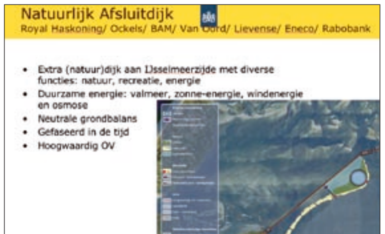
De Afsluitdijk in 2050.