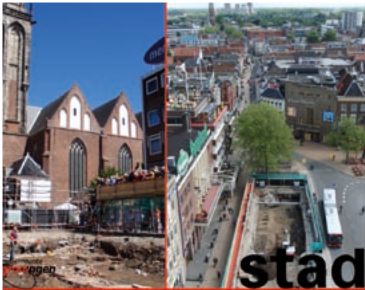
Archeologen aan het werk in Groningen.