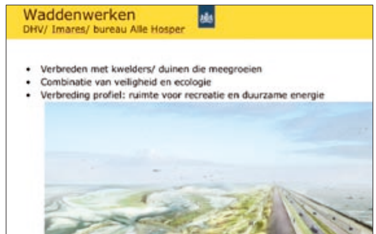
Artist impression van de vernieuwde Afsluitdijk.